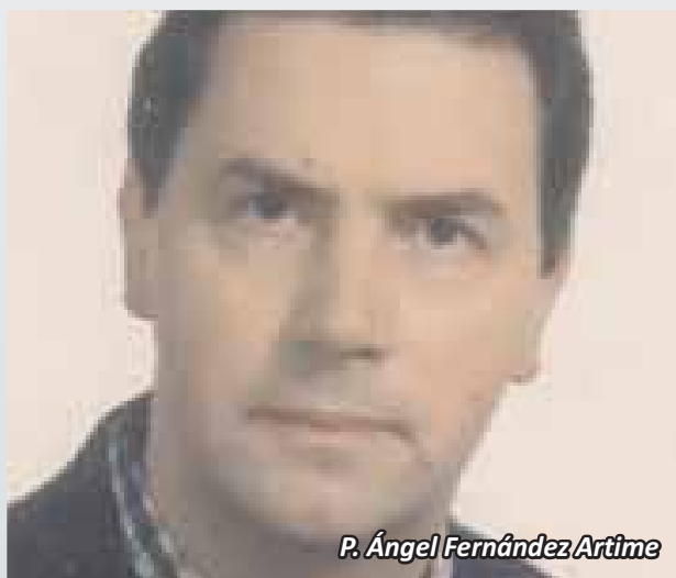
P. Ángel Fernández Artime